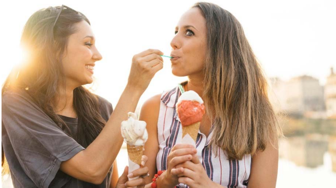
Zwei Frauen essen Eis: Wir verraten, in welchen Eisdielen es in Deutschland besonders gut schmeckt.

Von Ron Schlesinger 28.07.2018, 11:29 Uhr