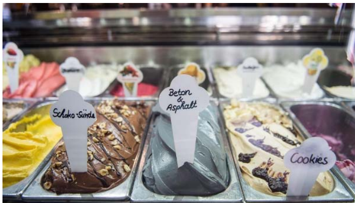
Besondere Eissorten: "Schoko-Sünde", "Beton & Asphalt" und "Cookies" werden im Stuttgarter Eiscafé "Flori & Palma" angeboten.

Adresse: Senefelderstraße 109, 70176 Stuttgart, geöffnet täglich von 8 bis 18 Uhr